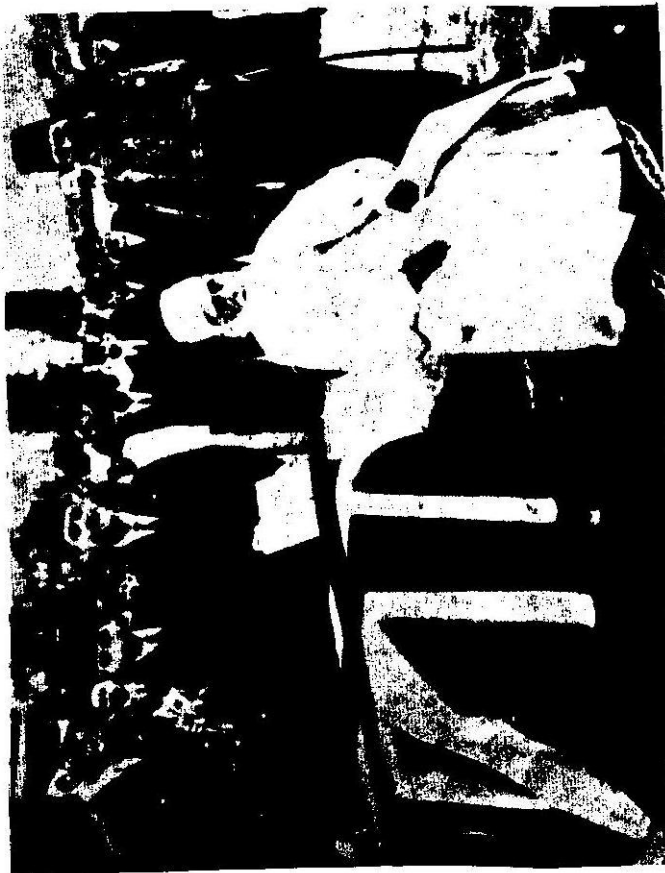
مراسم اعطای نشان «نایت هود» به سیر عبدالبهاء از طرف فرمانده انگلیسی در فلسطین اشغالی